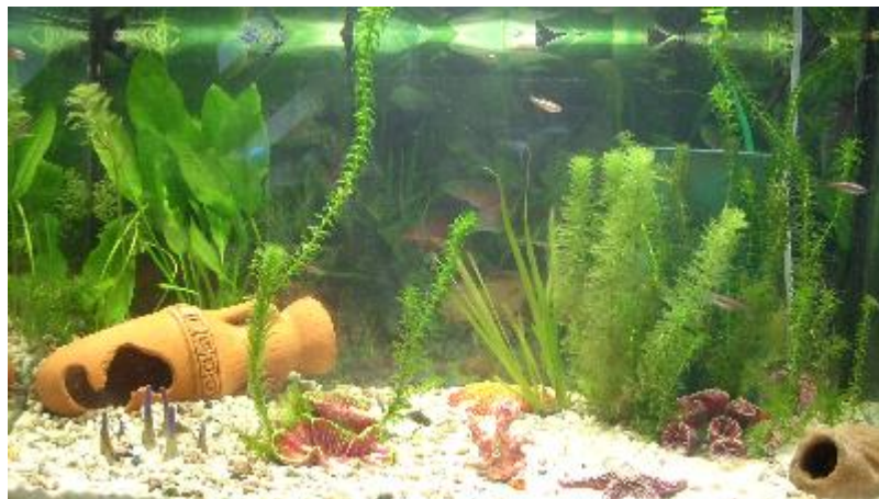
11.05.2007 Blick in mein Aquarium